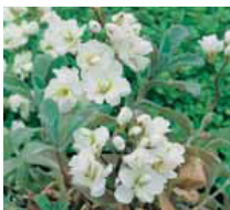
Arabis caucasica Gänsekresse