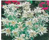
Leontopodium alpinum, Edelweiss