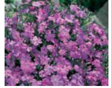
Phlox subulata Polsterphlox