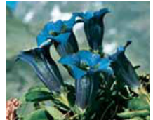
Gentiana acaulis Enzian