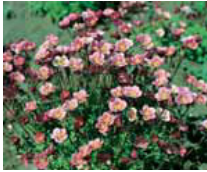
Saxifraga x arendsii Steinbrech