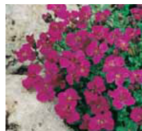
Aubrieta deltoidea Blaukissen