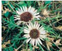
Carlina acaulis Silberdistel