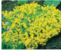
Sedum acre Fetthenne