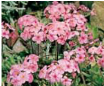
Androsace sarmentosa, Mannsschild