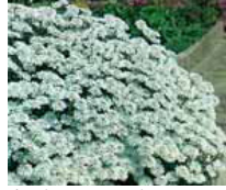
Iberis sempervirens Schleifenblume