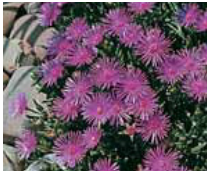
Delosperma cooperi Mittagsblume