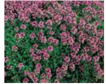
Thymus praecox Thymian