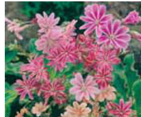
Linaria alpina Alpenleinkraut