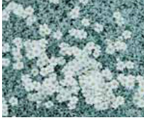
Cerastium tomentosum, Hornkraut