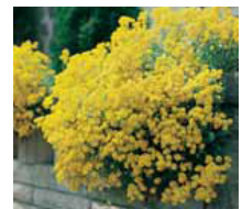
Aurinia saxatilis Steinkraut