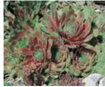
Sempervivum tectorum, Hauswurz