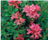
Rhododendron ferrugineum, Alpenrose