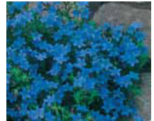
Thymus praecox Thymian